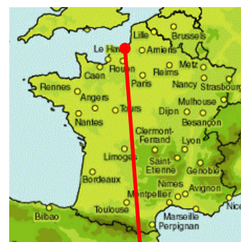
Station d'épuration de Dieppe

Afin de remettre à niveau la filière de traitement des boues de la station d'épuration de Dieppe, la Communauté d'Agglomération de la Région Dieppoise a décidé de réaliser un nouvel atelier de déshydratation par centrifugation.