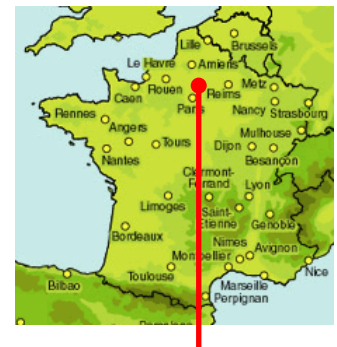
MOUSSY LE VIEUX

La construction concerne l'augmentation de la capacité de distribution par soutirage d'eaux brutes à partir d'un second forage complémentaire (à aménager) et le remplacement de l'unité de traitement existante par un traitement par déferrisation biologique puis distribution vers les communes de Moussy le Vieux et du Mesnil Amelot.