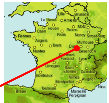
Usine de Chagny

Dans le cadre de l'amélioration des eaux distribuées par l'usine de Chagny, la collectivité Beaune Côte et Sud a souhaité mettre en place une installation de traitement des pesticides. En complément, cette usine, tournée vers l'exploitation, permettra d'amener l'eau à l'équilibre et de la désinfecter avant son transport dans le réseau.