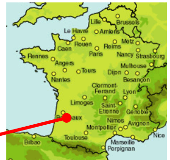
Forage de La Gravette Cadillac (33)

Le site de la Gravette est constitué de deux réservoirs semi-enterrés d'une capacité totale de stockage de 1 000 m 3 alimentés par 2 forages. Une distribution gravitaire et un surpresseur permettent l'alimentation en eau du Syndicat. Afin de sécuriser l'approvisionnement en eau potable, le SIEA des 2 Rives prévoit l'augmentation des capacités de production à partir d'un nouveau forage.